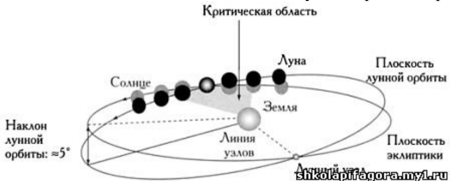
Рис.1. Плоскость орбиты Луны относительно плоскости эклиптики.

поскольку все-таки наклонены летом в сторону Солнца. Самыми холодными зимой видятся точки, отстоящие от земной оси на 23 градуса. Но Луна вращается в плоскости, составляющей с плоскостью эклиптики угол порядка 5 градусов.